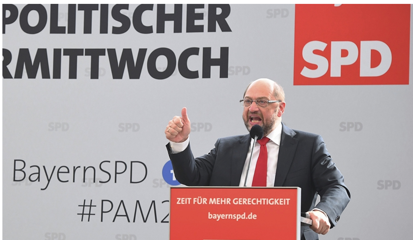
El líder del Partido Socialdemócrata (SPD), Martin Schulz, pronuncia su discurso durante un mitin del partido celebrado con motivo del miércoles de ceniza en Vilshoven (Alemania)

"A mí me han acusado de no haber representado intereses alemanes en Bruselas", dijo el expresidente del Parlamento Europeo (PE) en un acto electoral organizado en la localidad de Vilshofen con motivo del tradicional miércoles de ceniza, día en el que los partidos alemanes protagonizan distintos encuentros políticos.