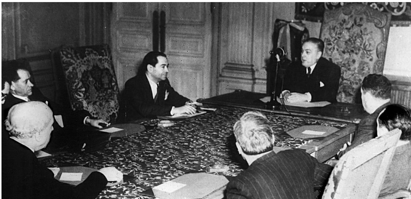
París, 13-2-1947.- Reunión del gobierno de la República en el exilio. En el sentido contrario a las agujas del reloj, desde la presidencia: Diego Martínez Barrio (presidente de la República), Rodolfo Llopis (Estado), Manuel de Irujo (Justicia), Fernando Varela Aparicio (casi fuera de la foto, a la izda) (Hacienda), Julio Just (Interior), Miguel Santaló (Instrucción Pública), Vicente Uribe (Economía) y Trifón Gómez (Emigración).