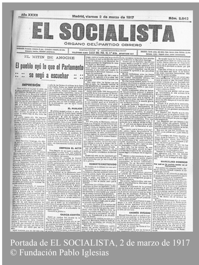
Portada de EL SOCIALISTA, 2 de marzo de 1917

Como se dijo al empezar el mitin era el que se celebraba un acto solemne, un acto histórico. No importa que los periódicos voceros de la Monarquía empleen hoy como táctica la de relegarle a segundo término, la de no darle importancia. Si efectivamente no se la conceden, demuestran con ello una ceguera inconcebible, vivir fuera de la realidad por completo; si lo hacen por simulación, para neutralizar los efectos de lo mucho y gravísimo que allí se dijo, tampoco podrán con ello engañar a nadie ni borrar esa misma realidad. Lo que es, es.