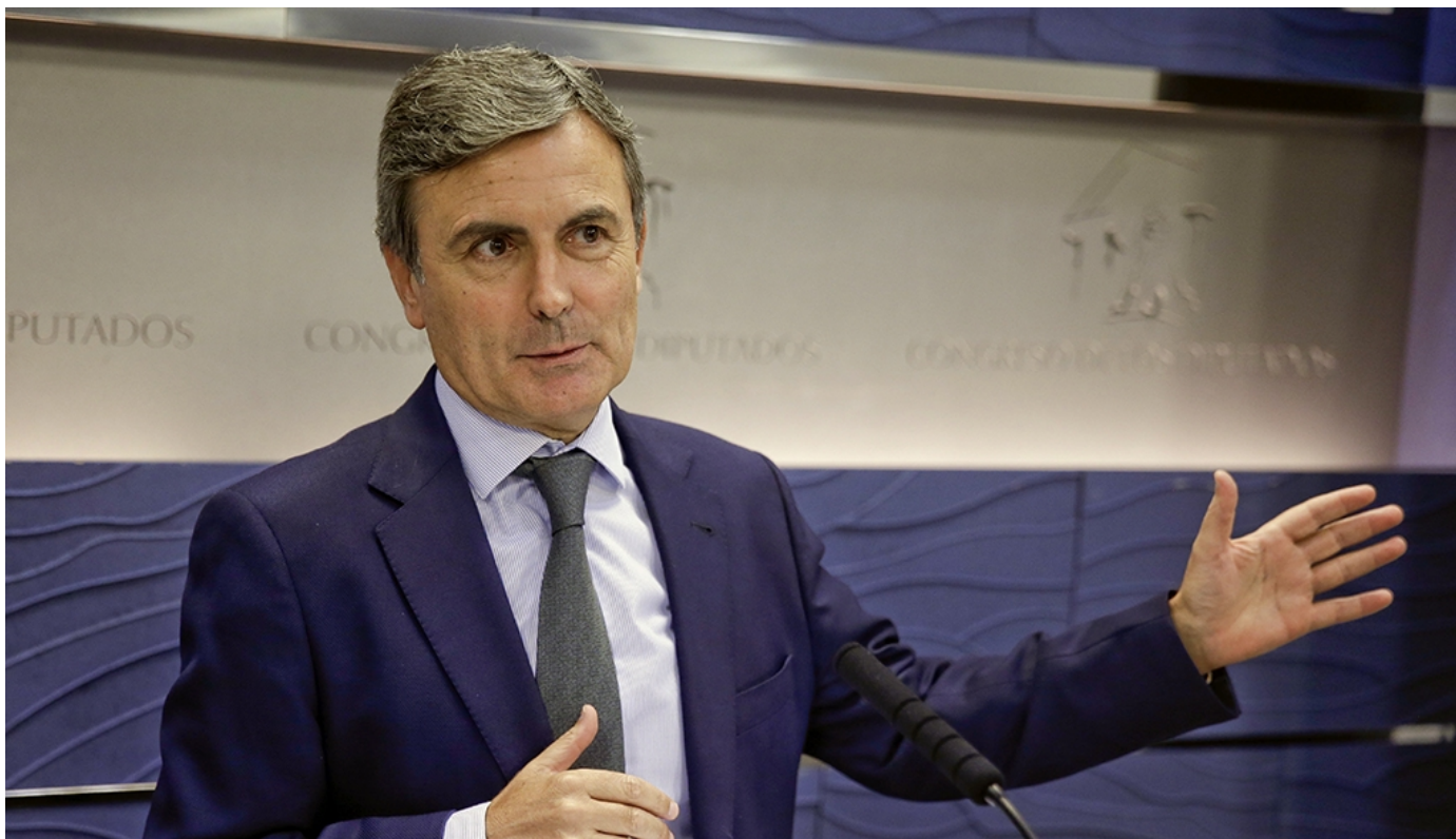
El portavoz de Economía del Grupo Socialista, Pedro Saura

MADRID / El portavoz de Economía del Grupo Socialista, Pedro Saura y el portavoz de Justicia, Juan Carlos Campo, han mostrado su satisfacción por el principio de acuerdo alcanzado con los Ministerios de Hacienda y Justicia para rectificar la decisión del gobierno y volver a dejar exentos de IVA a los abogados y procuradores del turno de oficio. Pedro Saura ha señalado que "con este acuerdo se soluciona un problema que había creado el propio Ministerio al obligarles a pagar el IVA a los abogados y procuradores". Juan Carlos Campo se ha felicitado porque "este compromiso beneficia a los 40.000 abogados que trabajan en el turno de oficio y que estaban muy preocupados". Tanto Saura como Campo subrayan que el Grupo Socialista seguirá trabajando y llevando a cabo una oposición útil que se enfrente al gobierno cuando sea necesario y alcance acuerdos cuando sean beneficiosos para la ciudadanía. El 25 de enero de este año, la Dirección General de Tributos, en respuesta a... LEER MÁS ►