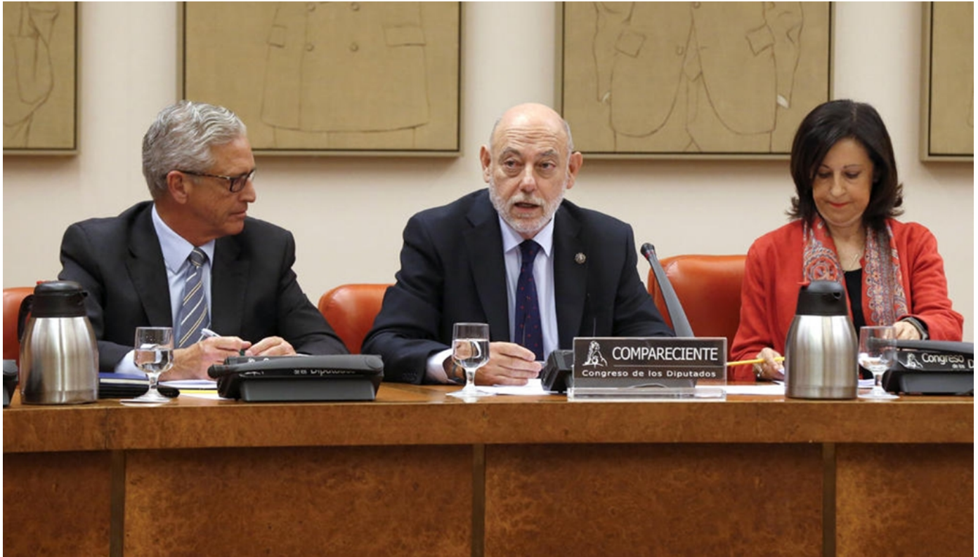
El Fiscal General del Estado (FGE), José Manuel Maza (c) junto a Margarita Robles en una imagen de archivo